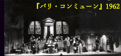
【パリ・コミュニケーション】1962