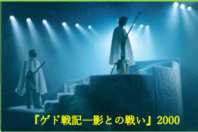
【ゲド戦記—影との戦い】2000