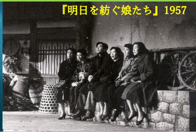
【明日を紡ぐ娘たち】1957