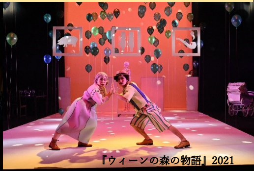
『ウィーンの森の物語』2021