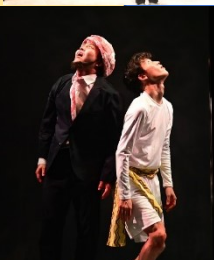
『タージマハルの 衛兵』2021