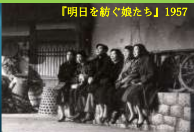
『明日を紡ぐ娘たち』1957