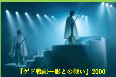
『ゲド戦記-影との戦い』2000